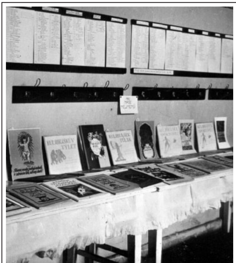
Každoročně se měnila místnost dětské čítárny ve výstavní sálek, ve kterém se představovaly nejkrásnější knihy pro děti.

Fotografie z klatovské dětské čítárny se používaly i na různých výstavách jako doklady o československém pokročilém knihovnictví. Mohli si je prohlédnout na výstavě soudobé kultury v Brně roku 1928, na výstavě lidovůchovné v Praze roku 1929 i na výstavě pedagogické v Ženevě roku 1929. V americkém časopise The Library Journal psal o naší čítárně ředitel