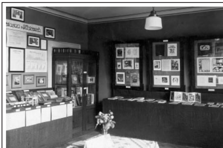
Expozice dětské čítárny v Klatovech na mezinárodní knihovnické výstavě v Praze v roce 1926.