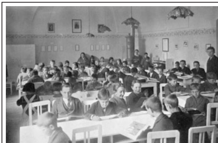
Pohled do dětské čítárny. Jeden ze snímků, který byl součástí expozice na mezinárodní knihovnické výstavě.