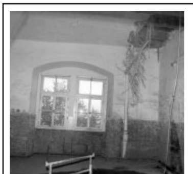
Pod dohledem Památkového ústavu prováděl Stavební podnik, a. s., Klatovy stavební úpravy historického objektu bývalé jezuitské koleje.

Provoz knihovny v nových prostorách byl slavnostně zahájen za přítomnosti významných hostů