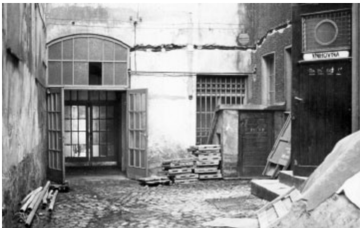
Nádvoří domu čp. 170/I v době rekonstrukce knihovny.

V roce 1968 nenastaly očekávané změny. Naopak následující roky přinesly tvrdá „normalizační opatření“, která se pochopitelně dotkla