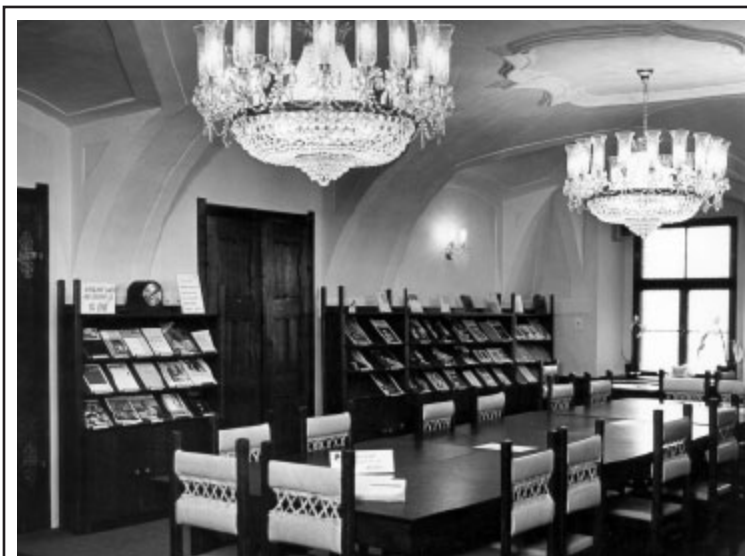
Čítárna po rekonstrukci.