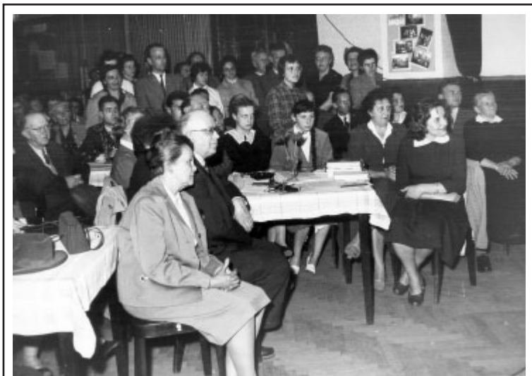
Účastníci besedy na sjezdu spisovatelů – rodáků při oslavách 100 let knihovny v Klatovech. Beseda se konala v Závodním klubu KOZAK v Krameriově ulici.

V roce 1967 bylo v historii knihovny poprvé dosaženo stotisící výpůjčky.