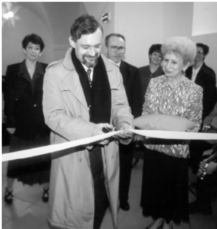
Slavností otevření městské knihovny v budově bývalé jezuitské koleje v Balbínově ulici. Pásku přestříhl náměstek ministra kultury Ilja Racek.

Společenské přeměny a rozvoj technických možností nutí pracovníky knihovny k rozšiřování nabídky služeb. Knihovna v současné době poskytuje nejen knihovnické služby, ale stává se i centrem informačních služeb. Připojením do sítě internet v roce 1998, napojením na knihovnický systém LANIUS a ukládáním knižního fondu v elektronické podobě