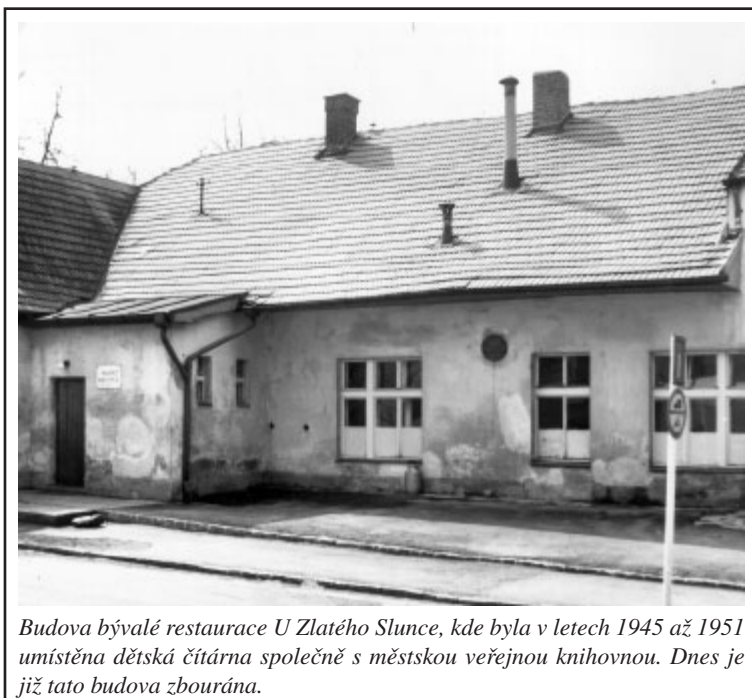
Budova bývalé restaurace U Zlatého Slunce, kde byla v letech 1945 až 1951 umístěna dětská čítárna společně s městskou veřejnou knihovnou. Dnes je již tato budova zbourána.

V roce 1950 byly vyhláškou ministerstva informací a osvěty zřizovány okresní lidové knihovny. V Klatovech došlo k ustavení okresní lidové knihovny 26. července 1951, kdy se sloučila Aimova dětská čítárna s ve-