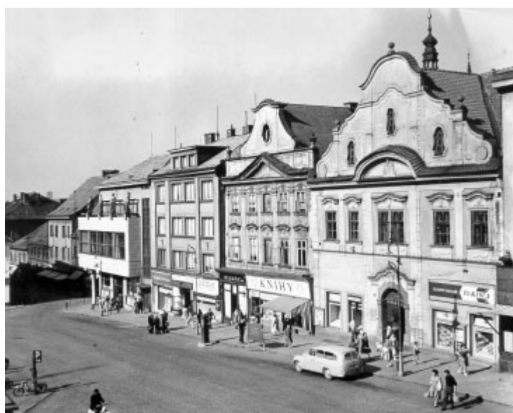
Budova čp. 170 na klatovském náměstí, kde knihovna sídlila až do roku 1998. Knihovna užívala rovněž několik místností přilehlého sousedního domu čp. 169.