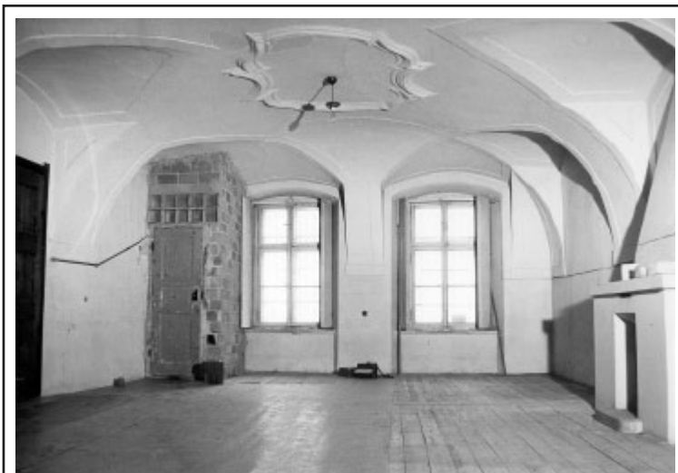
Pohled do místnosti v domě čp. 169/I, kde byla po rekonstrukci umístěna čítárna a vlastně i jediná reprezentativní místnost knihovny.